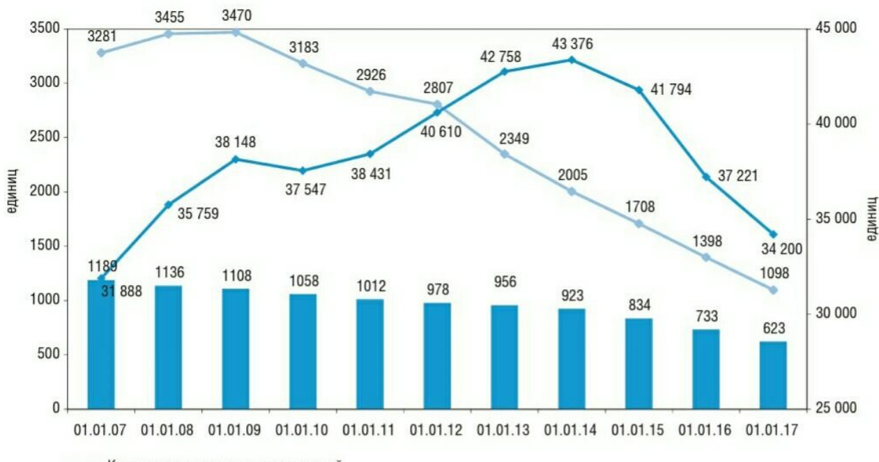
Рис. 2. Динамика числа действующих кредитных организаций и отзывает у кредитных организаций лицензий.

Динамика числа действующих кредитных организаций представлена на рисунке 2 [ 8, С. 21]