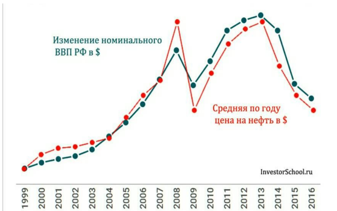
Рис.1 Взаимосвязь темпов роста ВВП и роста цен на нефть в 2007-2016 гг.

Показатели темпов роста ВВП и роста цен на нефть, представлены на рисунке 1 [ http://investorschool.ru/ ]