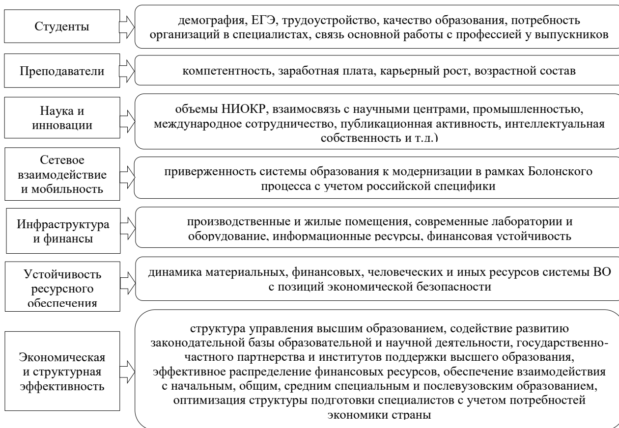
Рисунок 1 – Элементы экономической безопасности высшего образования

Существуют различные подходы к классификации видов ЭБВО. Первый подход рассматривает ЭБВО как совокупность ее основных видов: финансовая безопасность высшего образования, кадровая безопасность высшего образования, управленческая безопасность высшего образования, информационная безопасность высшего образования, научно-техническая безопасность высшего образования. (см. рисунок 2).