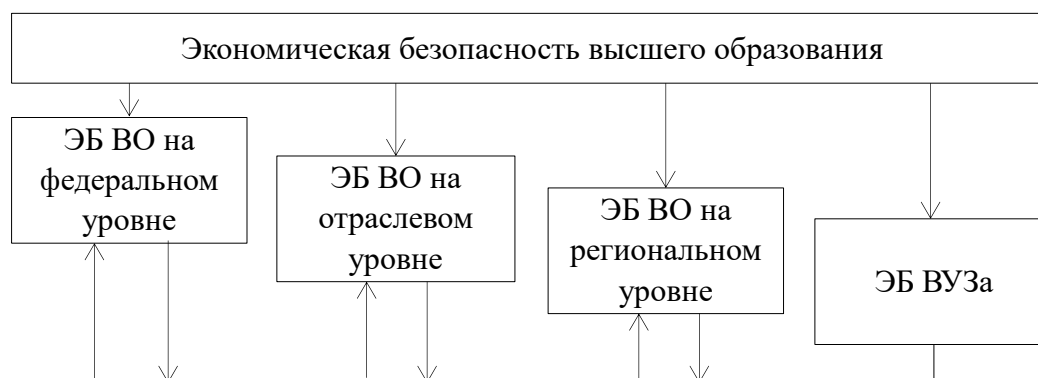
Рисунок 3 – Уровни ЭБВО

Второй (иерархический) подход предусматривает выделение ЭБВО на федеральном уровне, ЭБВО на региональном уровне, ЭБВО на отраслевом уровне, ЭБ вуза (см. рисунок 3).