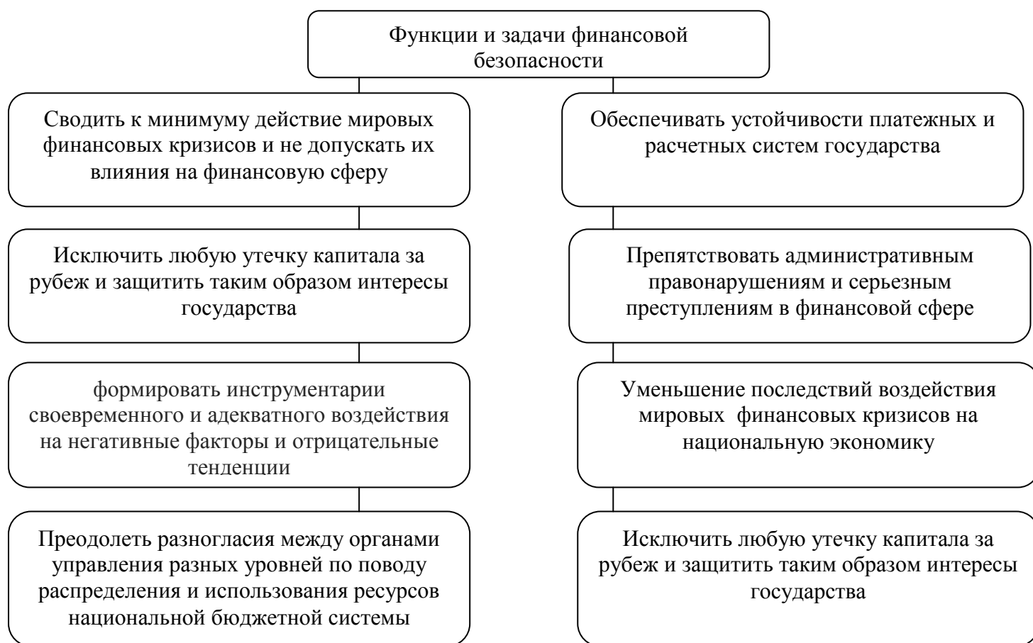
Рисунок 3 – Функции и задачи финансовой безопасности

Влияние финансовой безопасности на стабильность экономической безопасности страны проявляется в различных функциях и задачах, которые выполняются непосредственно за счет финансовой системы регионов. Данные функции представлены на рисунке 3.