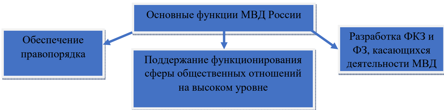
Рисунок 1 – Основные функции МВД России

Существуют так же и особые функции: охрана особо важных режимных объектов, государственных учреждений и территорий, имущества физических и юридических лиц, осуществление в соответствии с законодательством Российской Федерации оперативно-розыскной деятельности и охрана экономической системы страны уполномоченными подразделениями. Вид системы представлен на рисунке 2: