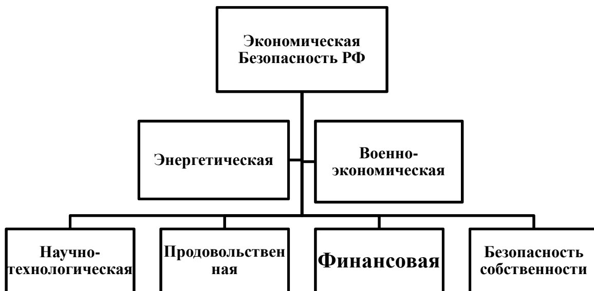
Схема 1 — Компоненты структуры устройства национальной экономической безопасности

В объект исследования системы экономической безопасности входят: природные богатства, производственные и непроизводственные фонды, недвижимость, денежные ресурсы и другие.