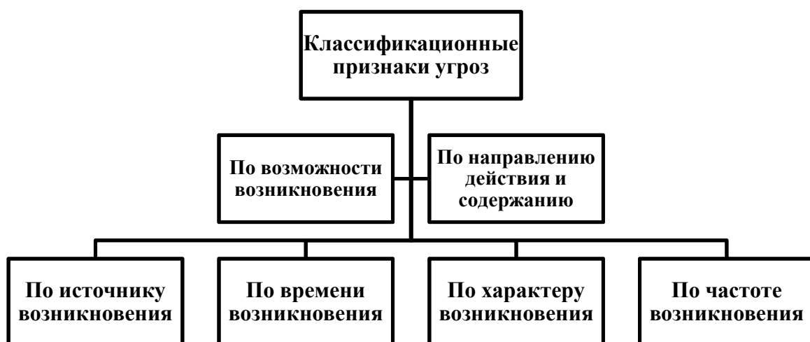
Схема 3 — Виды угроз экономической безопасности по классификационным признакам

Система статистических показателей содержит следующие характеристики: универсальность и взаимосвязанность. По мере изменения национальной экономики система показателей также постоянно меняется.