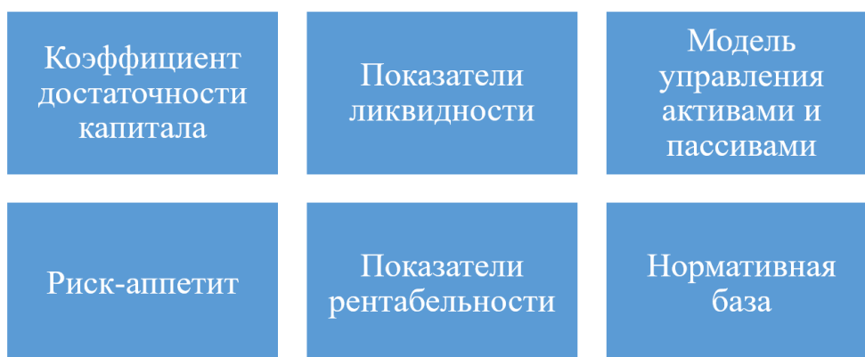
Рисунок 2. Показатели, учитываемые при анализе финансовой стратегии

При проведении анализа финансовой стратегии изучают следующие показатели, представленные на рисунке 2.