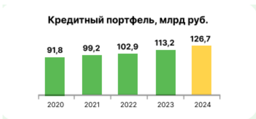
Рисунок 3. Динамика кредитного портфеля

Сфера кредитования является важной составляющей деятельности банка, так как именно она приносит больший доход. Рассмотрим показатели кредитного портфеля ПАО КБ «Центр-инвест»(рис.3) 1