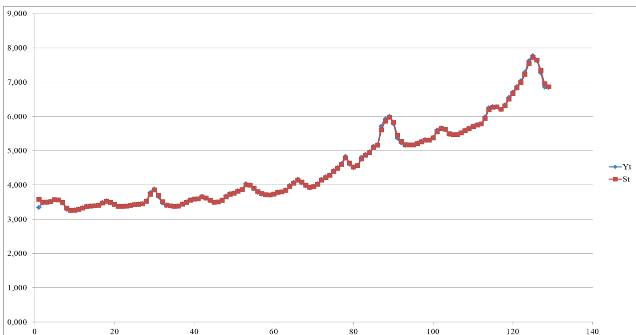
Рис. 2. Графики исходного и экспоненциально сглаженного ряда

Вычислим по формуле (1) экспоненциальные средние и с помощью графика сравним их с исходным временным рядом (рис. 2).