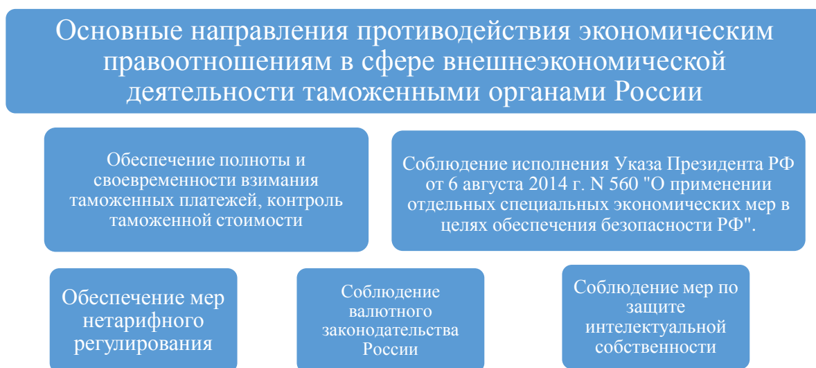
Рис 2. Основные направления противодействия экономическим правоотношениям в сфере внешнеэкономической деятельности таможенными органами России

таможенных органов зависит от правильного использования системы управления рисками, которая является ключевым инструментом таможенного контроля.