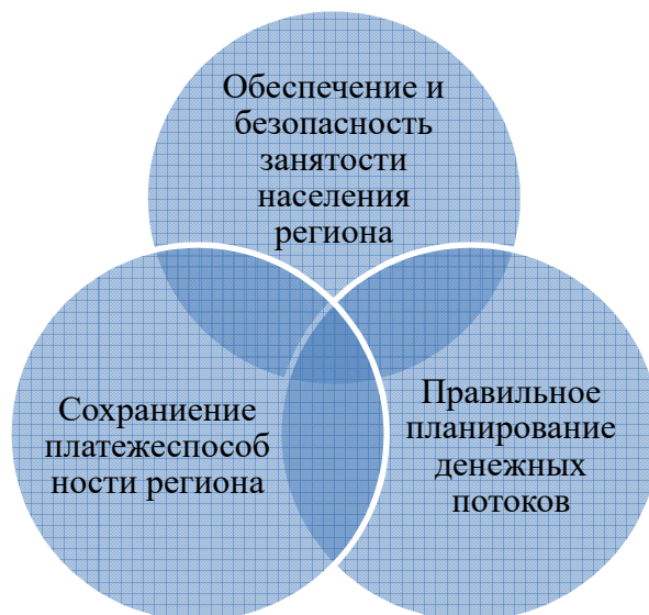
Рисунок 1.- Условия экономической безопасности региона

В Ростовской области, как и в других субъектах России, система обеспечения экономической безопасности региона имеет свою специфику, основанную на параметрах, свойственных ряду территориальных образований государства: географическое положение, климатические и демографические условия, степень социально-экономического развития и т.д.