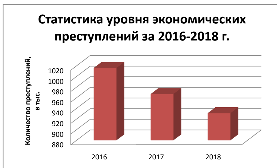
Рис. 1 - Статистика уровня экономических преступлений за 2016-2018 г.

В современной России нередко задаешься вопросом об уровне экономической преступности. Анализируя данную ситуацию можно прийти к выводу, что без вмешательства государства невозможна борьба с такими видами правонарушений. Поэтому в России существует Главное управление экономической безопасности и противодействия коррупции (ГУЭБиПК). Это подразделение занимается предупреждением, выявлением и раскрытием коррупционных преступлений как среди предприятий и организаций, так и физических лиц. Можно смело сказать, что основными функциями данного отдела являются предотвращение преступлений в экономической сфере, а также формирование мер борьбы по уже совершенным деяниям. Однако, чтобы полностью понять масштаб ситуации нужно провести статистический анализ по нескольким критериям. Поэтому первым критерием исследования станет уровень преступности в России за последние несколько лет, данные которых показаны на рисунке 1[1].