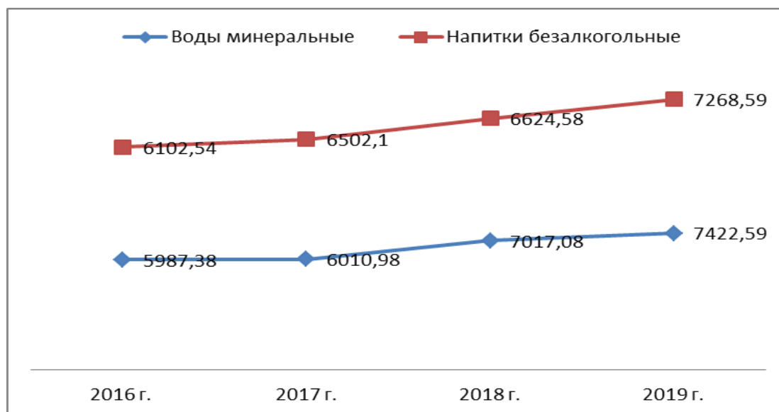
Рис.2. Объем производства безалкогольных напитков в РФ, млн л. 2

Динамика производства безалкогольных напитков в РФ за 2016-2019 годы представлена на рисунке 2.