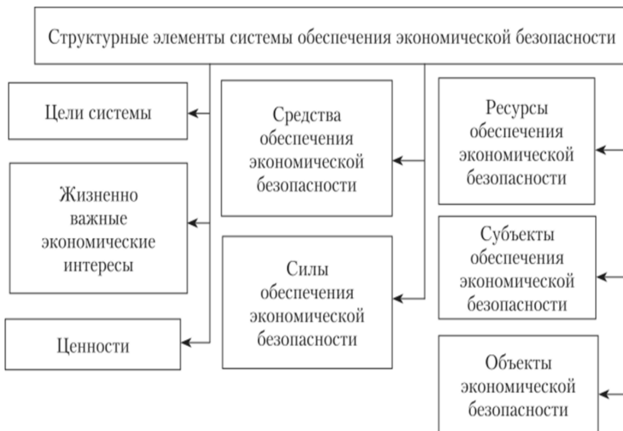
Рис. 3. Структурные элементы системы обеспечения экономической безопасности

По данным рисунка видно, что все элементы напрямую связаны с системой обеспечения экономической безопасности, а именно отражают объективные потребности как самого государства и общества, так и личности в различных их проявлениях.