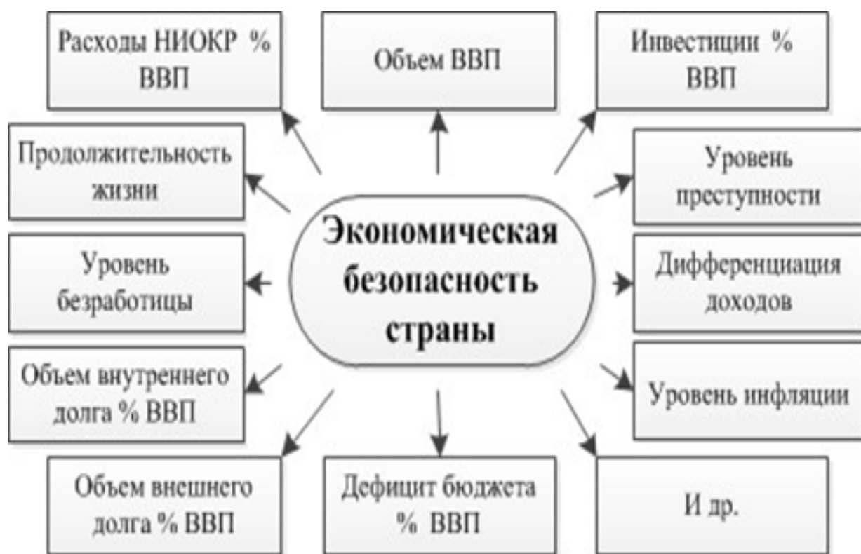
Рис. 5. Показатели экономической безопасности страны

Экономическая безопасность страны определяется множеством показателей, которые представлены на рисунке 5: