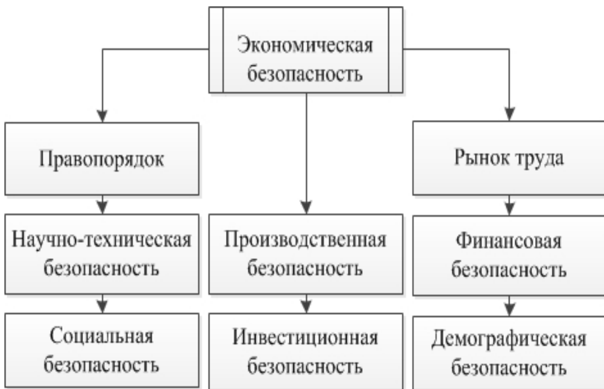
Рис. 6. Состав экономической безопасности

Понятие экономическая безопасность с точки зрения разделения на показатели нескольких сфер представляет собой следующую систему: