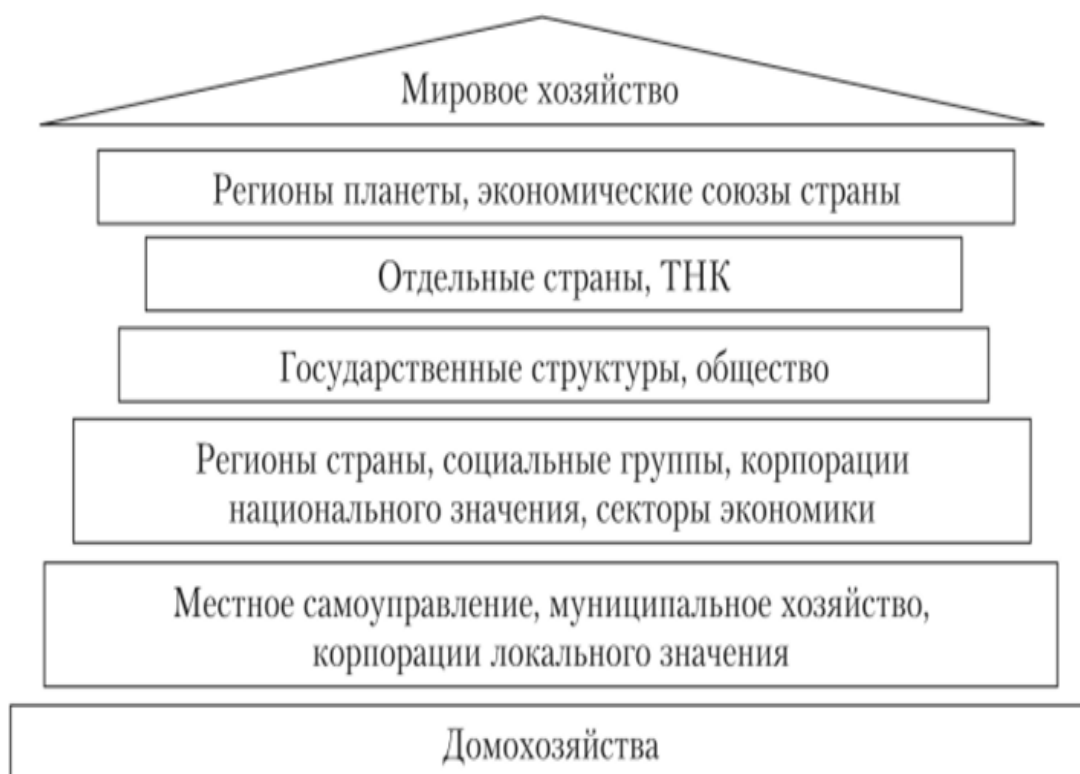
Рис. 4. Уровни систем обеспечения экономической безопасности

Каждый объект экономической безопасности имеет ряд своих особенностей, которые соответствуют отдельным системам, связанных с обеспечением экономической безопасности. Размер каждой из систем отличается тем, что сложность выполняемых функций, количество частей, входящих в нее различны. Все это зависит, непосредственно, от самого содержания объекта экономической безопасности. Вследствие этого, все системы объектов экономической безопасности разделяются и выстраиваются в иерархическую пирамиду, которая начинается с более сложных систем, начиная сверху, идущих прямым к ее основанию, к более простым, но к самым многочисленным. Данная пирамида содержит 7 уровней, формирующихся от сложного к простому, сверху вниз, что представлено на рисунке 4: