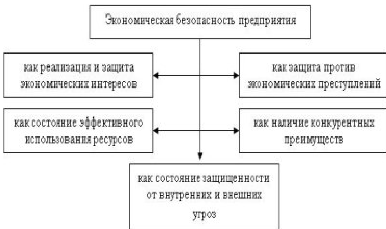
Рис. 1. Подходы к определению экономической безопасности

Экономическая безопасность – это состояние национального хозяйства, которое способно обеспечивать поступательное развитие общества, его социально-экономическую, финансовую стабильность, высокую обороноспособность в обстоятельствах воздействия негативных внутренних и внешних факторов, обеспечение экономических интересов на мировых и на отечественном уровнях, а также эффективное результативное управление. Все вышеперечисленные факторы представлены на рисунке 1: