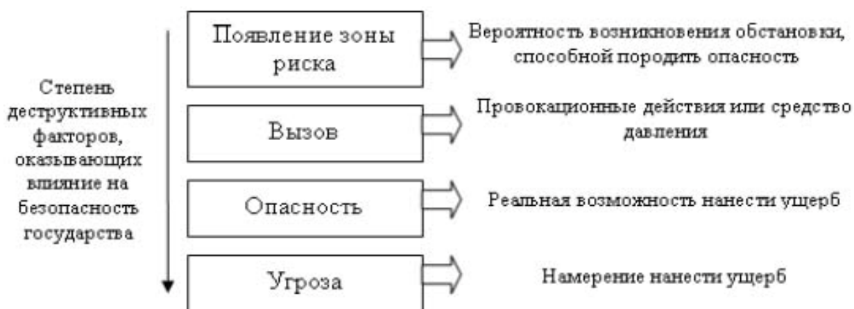
Рис. 7. Система понятий, отражающих степень факторов, оказывающих влияние на экономическую безопасность государства

На рисунке 7 представлена информация о факторах, которые в свою очередь оказывают влияние на функционирование всей системы экономической безопасности и возможных негативных результатов. Для их предотвращения необходимо понимать всю важность положительного процесса развития и функционирования экономической безопасности на всех уровнях государства и его субъектов. [6]