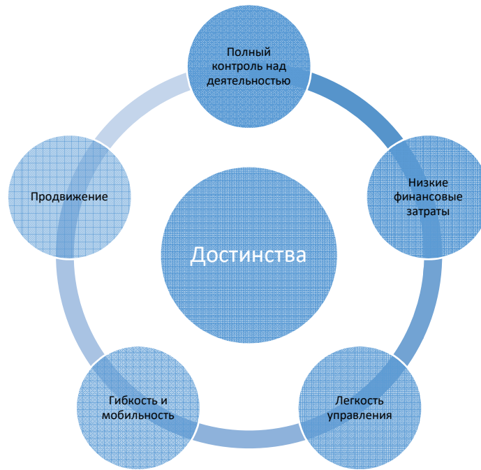
Рисунок 1 – Достоинства малого бизнеса