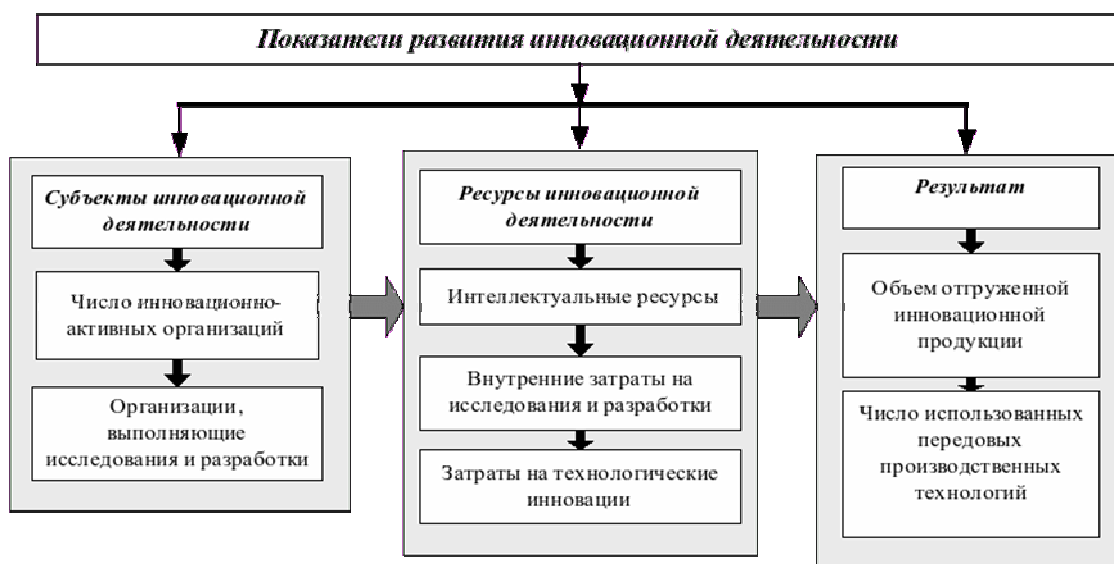
Рис.1 – Показатели развития инновационной деятельности[5]

Для мониторинга и управления инновационной деятельностью как в целом по России, так и в отдельных ее субъектах, необходима комплексная система статистических показателей инновационного развития регионов РФ и определяющих его индикаторов, представленных на рисунке 1.