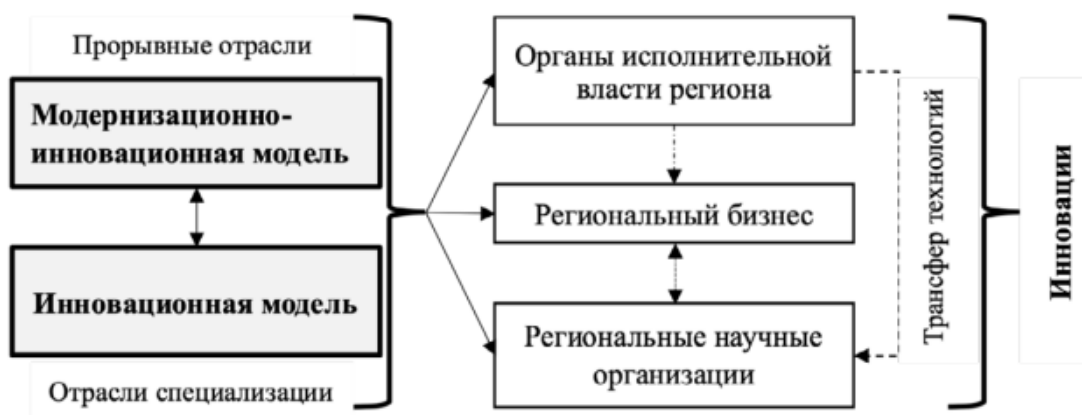
Рис.3–Комбинированная модель развития инновационной сферы Ростовской области[2]

Одна из моделей развития инновационной политики Ростовской области, предложенная Г.А. Абрамяном, представлена на рисунке 3.