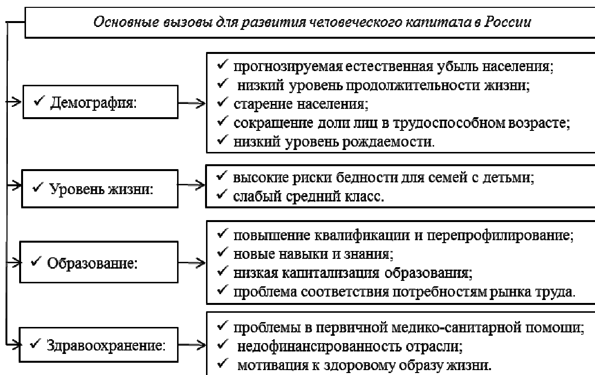
Рисунок 3 – Основные вызовы для развития человеческого капитала в России 1

Человеческий капитал выступает в качестве составляющего элемента богатства любого государства, в России его доля составляет в 2020 году только 46 %, что замедляет рост ВВП, поэтому в качестве основных направлений его роста следует выделить: